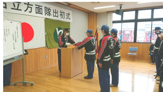
▲ 名立方面隊消防出初式の様子 ▲