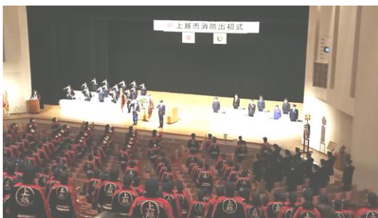
▲上越文化会館で実施された上越市消防出初式

令和5年1月8日(日曜日)午前9時30分から、3年ぶりとなる上越市消防出初式が上越文化会館で開催され、名立方面隊も方面隊長以下17名の団員が出席しました。